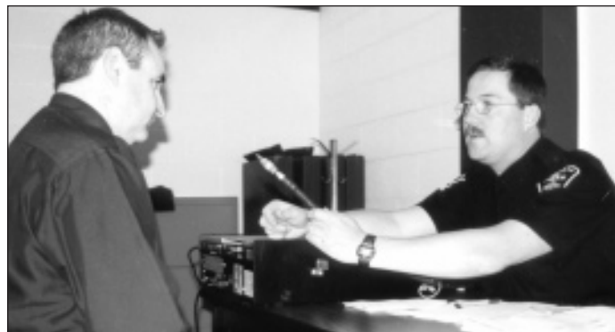
Des policiers spécialement formés et des toxicologues qualifiés en analyse d'haleine étaient sur place au centre de formation de Durham College (Oshawa) pour consigner les résultats.

Canada. « Deuxièmement, nos observations nous ont aidées à mieux comprendre l'effet de la progression du niveau d'affaiblissement des facultés sur les habiletés de conduite. »