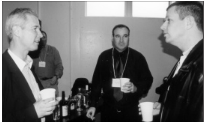
Les participants ont été invités à consommer jusqu'à ce qu'ils affichent des TA de 0,08 % afin de permettre une évaluation de leurs habiletés.