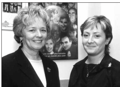
MADD Canada a aussi rencontré Alexa McDonough, Chef du N.P.D.