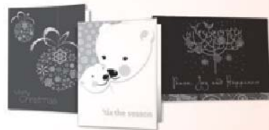
Exemples de cartes de souhaits.

MADD Canada s'est engagé à améliorer la sécurité de nos routes et de nos voies maritimes pour tout le monde. Votre participation au programme de cartes de souhaits de MADD Canada contribue à la réalisation de cet objectif.